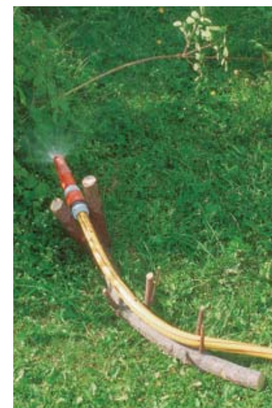
Vanning er viktig i fjellbygdene i Nord-Gudbrandsdalen. Det kommer så lite regn at folk fra gammelt av måtte lære seg å skaffe vann fra fjellet. I Haukdalen har de funnet en original støtte til vannslangen.