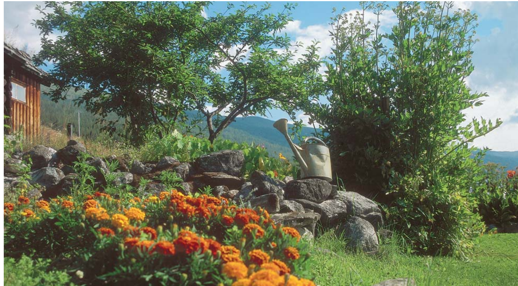
En frodig hage og brune tømmervegger står godt til hverandre. Tagetes og frodig løpstikke trives godt i hagen.

... den vesle haveflekken med noen sparsomme asters skulle vi omdanne til et paradisi.